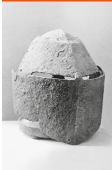
Hełm garnczkowy z Lubusza, XIV wiek, udokumentowany w zbiorach Lubuskiego Muzeum Powiatowego w Münchebergu