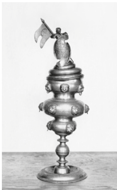
Wilkom piekarzy z Lübben, XVIII wiek, udokumentowany w zbiorach Heimatmuseum w Lübben

Mówiąc najogólniej nastąpiło powszechne oderwanie zbiorów od ich korzeni. Poza stratami materialnymi i kulturowymi oznaczało to długotrwale skutkującą utratę kontekstu, w którym funkcjonowało dzieło sztuki. Przyczyniło się to do zatracenia cennych informacji o pochodzeniu i historii wielu obiektów muzealnych.